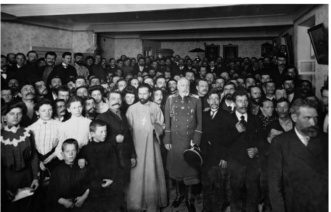
Поп Гапон и градоначальник С-Петербурга И.А.Фуллон в Собрании русских фабрично-заводских рабочих. 1904 г.

Гапон понимал, что к краху Зубатова привело неумелое вмешательство во взаимоотношения рабочих с предпринимателями, поэтому положения Устава Собрания были сформулированы предельно корректно и лояльно. Особо подчёркивалась культурно-просветительская направленность: борьба с пьянством и азартными играми, оборудование читален, организация музыкальных кружков, лекций, концертов, чаепитий, открытие похоронной кассы, кассы взаимопомощи и т. д.