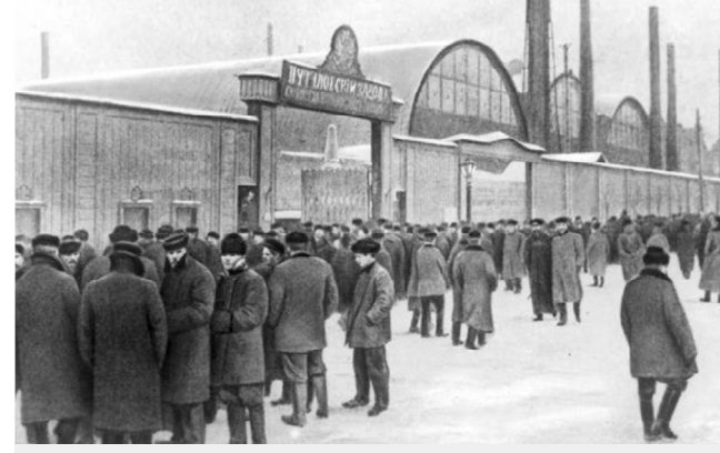
Бастующие рабочие у проходной Путиловского завода

В защиту уволенных выступило и Собрание, причём были направлены три делегации: к директору завода, к фабричному инспектору и к градоначальнику с условием «если законные требования рабочих не будут удовлетворены, то Собрание не ручается за спокойное течение жизни города». По сути это был вызов, оскорбительный для власти, поэтому переговоры оказались безрезультатными. Забастовка стала неизбежной.