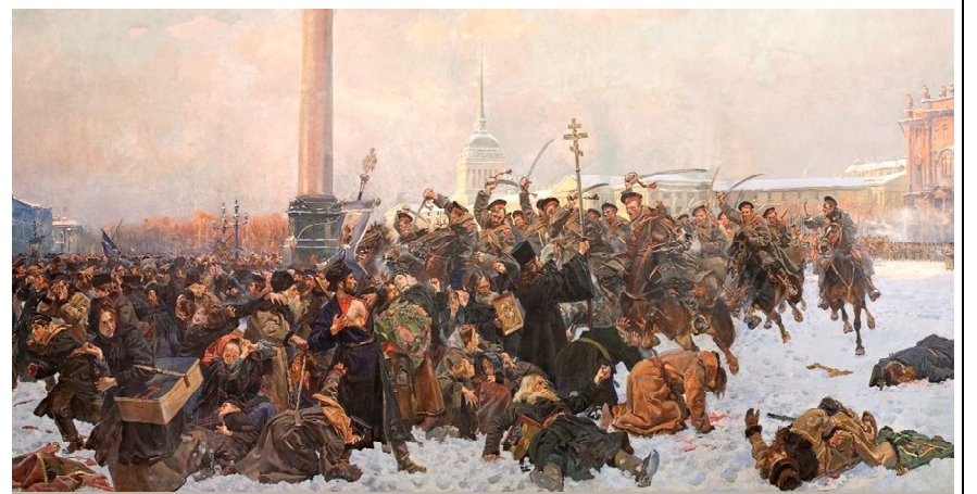
В.Коссака «Кровавое воскресенье»